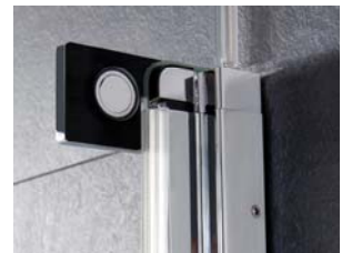
Beschlageinheit Glas/Wand, innen, Design eckig | hinge unit glass/wall, inside, design square