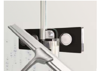
Flächenbündige Glasbefestigung, einfache Reinigung von innen | countersunk glass fixing, easy to clean from inside