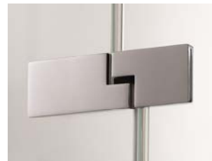
Band Glas/Glas 180°, Design eckig | hinge glass/glass 180°, Classic shape with offset glass edges, design square