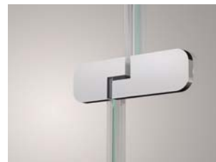
Band Glas/Glas 180°, Design rund | hinge glass/glass 180°, Classic shape with offset glass edges, design round